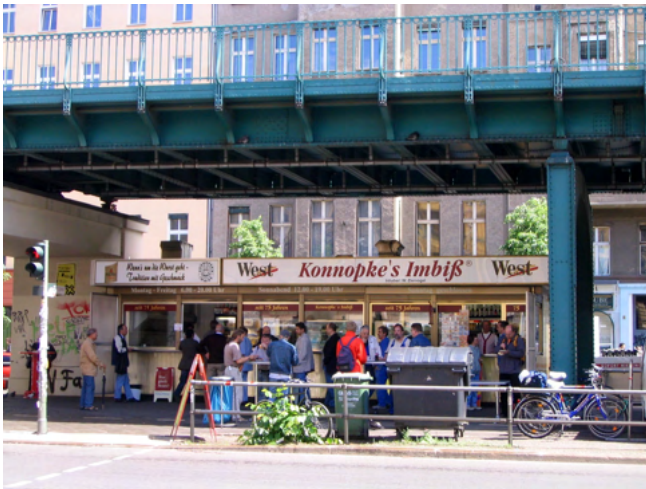
Konnopkes Imbiss unter der U-Bahn in Berlin

Kurzfristige Maßnahmen: Die zentralen, aber brach liegenden Flächen unter der Hochstraße können zumindest temporär anders genutzt werden. Denkbar wären z.B. Lichtinstallationen oder Gastronomie/Street Food nach dem Vorbild anderer Städte, etwa wie in Berlin oder Hamburg unter S- und U-Bahn-Trassen.