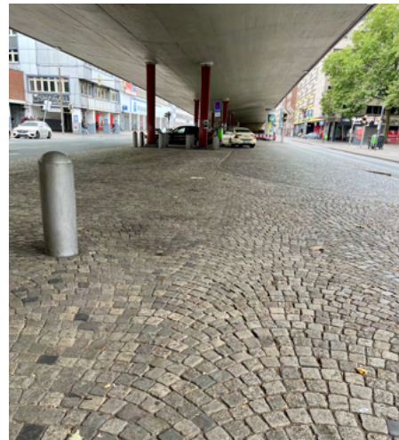
Viel freie Fläche unter der Hochstraße

Langfristige Maßnahmen: Um die Entscheidungsfindung über die langfristige Nutzung der Hochstraße zu erleichtern, muss deren baulicher Zustand und der ggf. Aufwand einer anstehenden Sanierung durch Fachleute geprüft werden. Sollte ein langfristiger Erhalt unter vertretbarem Aufwand möglich sein, könnte z.B. eine Begrünung nach dem Vorbild des New Yorker High Line Parks eine attraktive grüne Lunge im Herzen der Stadt schaffen.